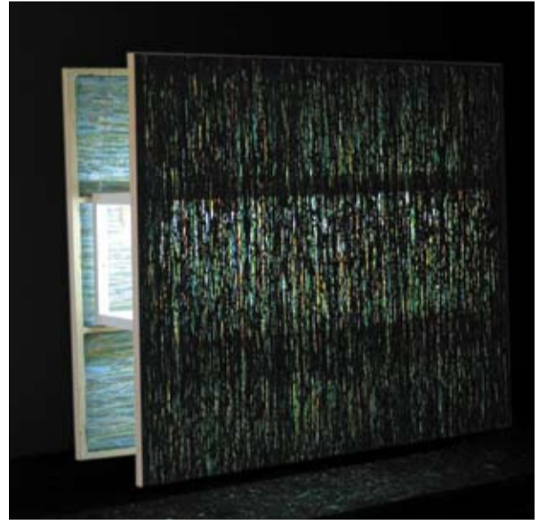
Versuchsanordnung für eine Farbraumpolarisation, 150 x 170 x 50 cm, Acryl auf Nylon, 2005