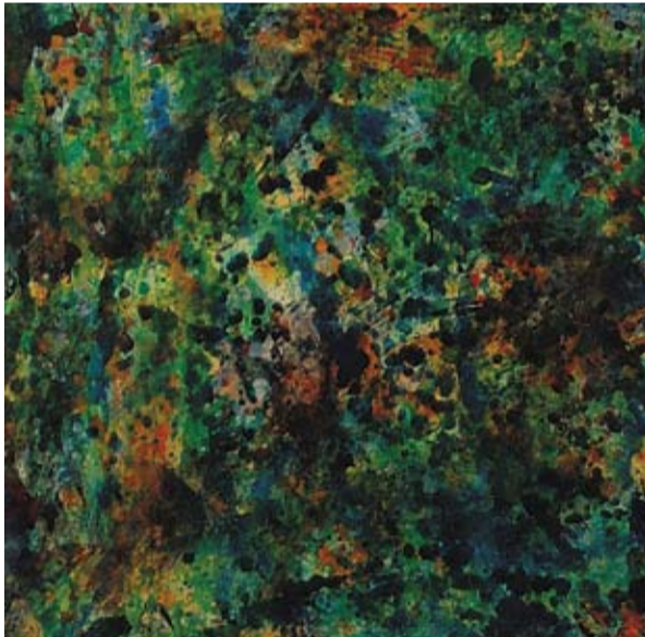
Detail aus „Atmosphärische Farbraumstruktur“ Acryl auf Nessel, 2004-2005