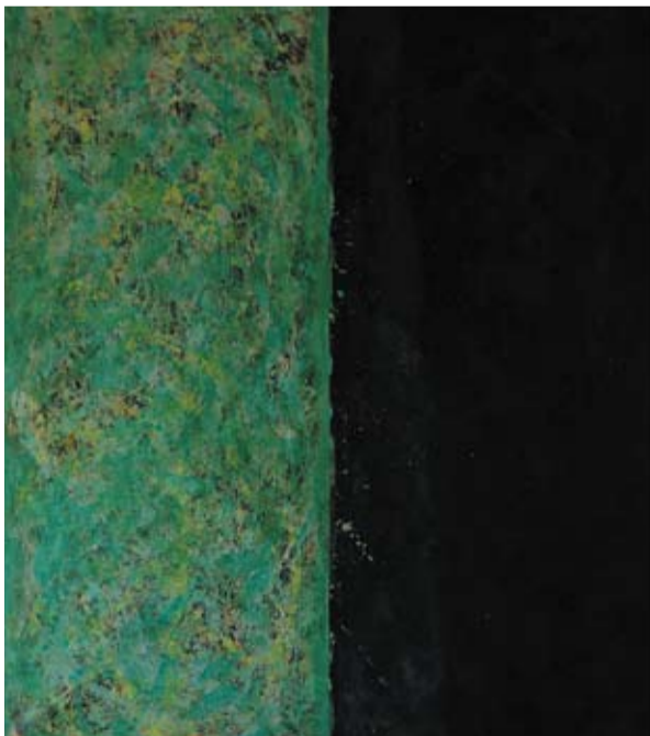
Farbraumfraktur, grün 210 x 180 cm, Acryl auf Leinen, 1998 - 2004